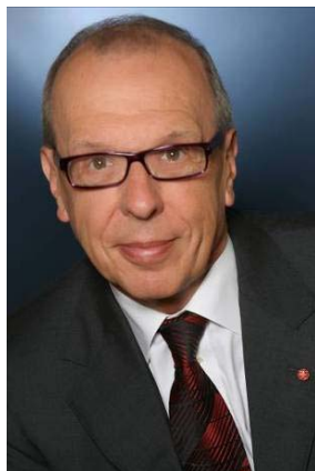
Robert Chappell, OBE, MPhil, DSc(hon), FCOptom Londres, Angleterre

Robert Chappell est le président du Conseil Mondial d'Optométrie ( World Council of Optometry, WCO ), qui représente plus de 250 000 optométristes issus de 40 pays. Le WCO a pour mission de favoriser l'amélioration et le développement des soins oculaires et la protection de la vue dans le monde. Robert Chappell est également administrateur de l'International Association for the Prevention of Blindness et président de la branche britannique de l'Optometry Giving Sight.